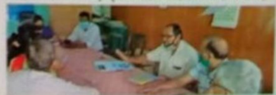
बैठक में भाग लेते कॉलेज के छात्रछात्रा।